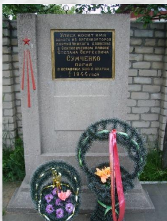
Мемарыяльны знак Сумчанку С. С. на скрыжаванні вуліц Сумчанкі і Інтэрнацыянальнай

За мужнасць і гераізм, праяўленыя ў барацьбе з нямецка-фашысцкімі захопнікамі, С. С. Сумчанка пасмяротна быў узнагароджаны ордэнам Чырвонага Сцяга. Галоўная вуліца ў Асіповічах пасля вайны была названа яго імем.