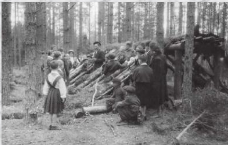
Летняя база 210-га партызанскага атрада

У сакавіку 1942 года у раёне афіцыйна арганізаваўся першы партызанскі атрад № 210, які пазней атрымаў імя І. В. Сталіна. Сумчанку прызначылі начальнікам штаба атрада (са жніўня 1942 г. па сакавік 1943 г. Сумчанка выконваў таксама абавязкі камандзіра 1-й Асіповіцкай партызанскай брыгады, а затым – намесніка камандзіра брыгады па разведцы).